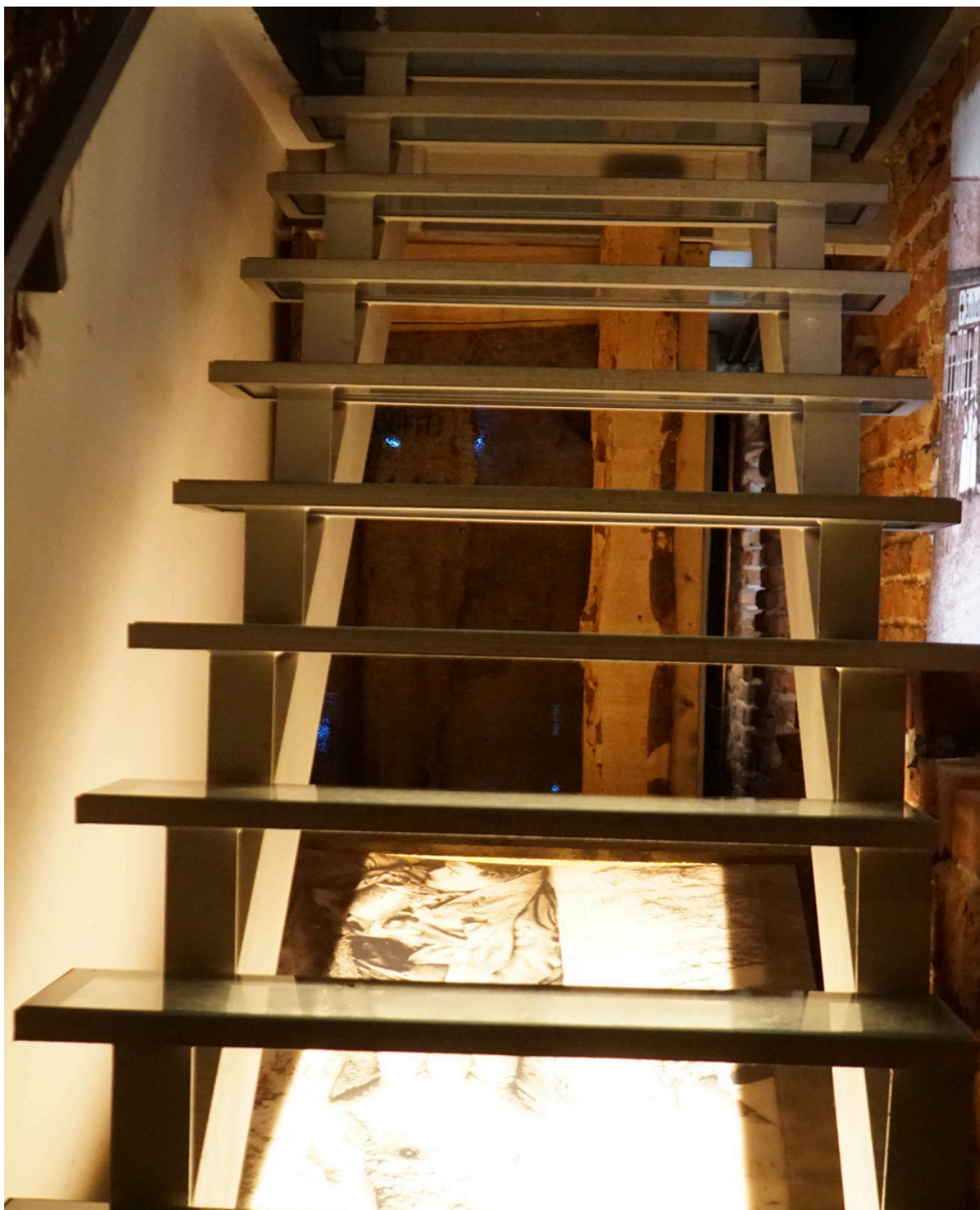
Schody prowadzące do kolejnego pomieszczenia.